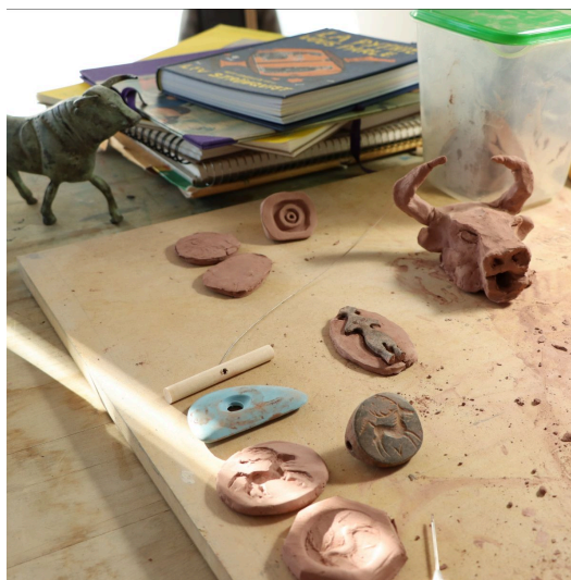
Jean-Sébastien Veilleux en studio, 2024.