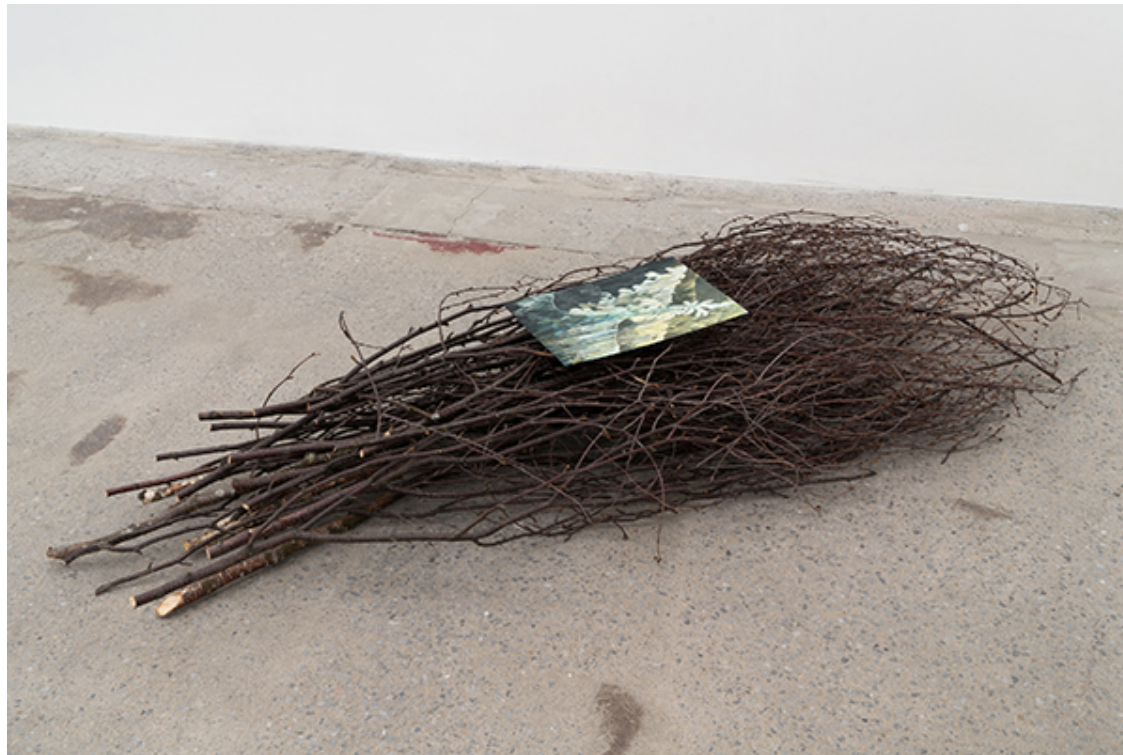
Andréanne Godin, Laying on , 2020, gouache sur papier et branches de bouleau, 175 x 80 x 25 cm.