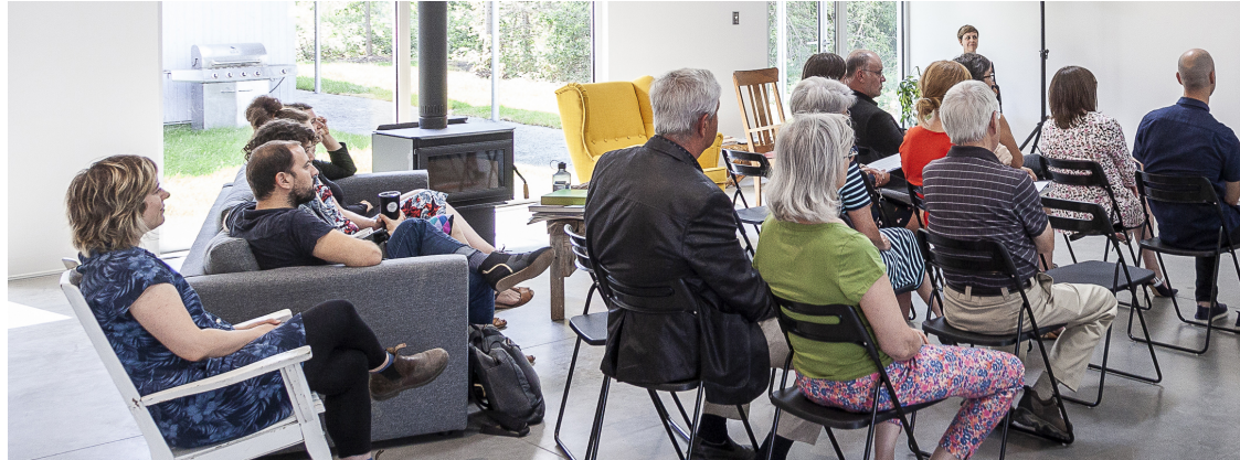
ENE, 2019.