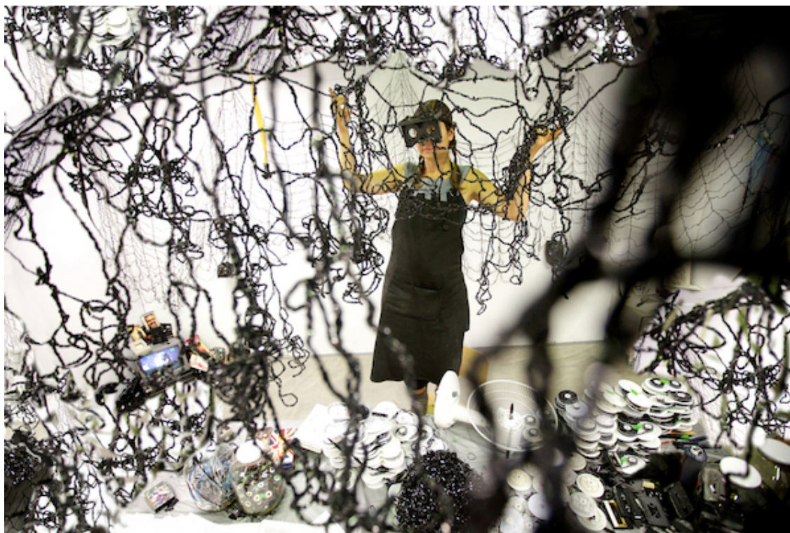
Giorgia Volpe, Exercices de Mémoire , 2016, installation performative.