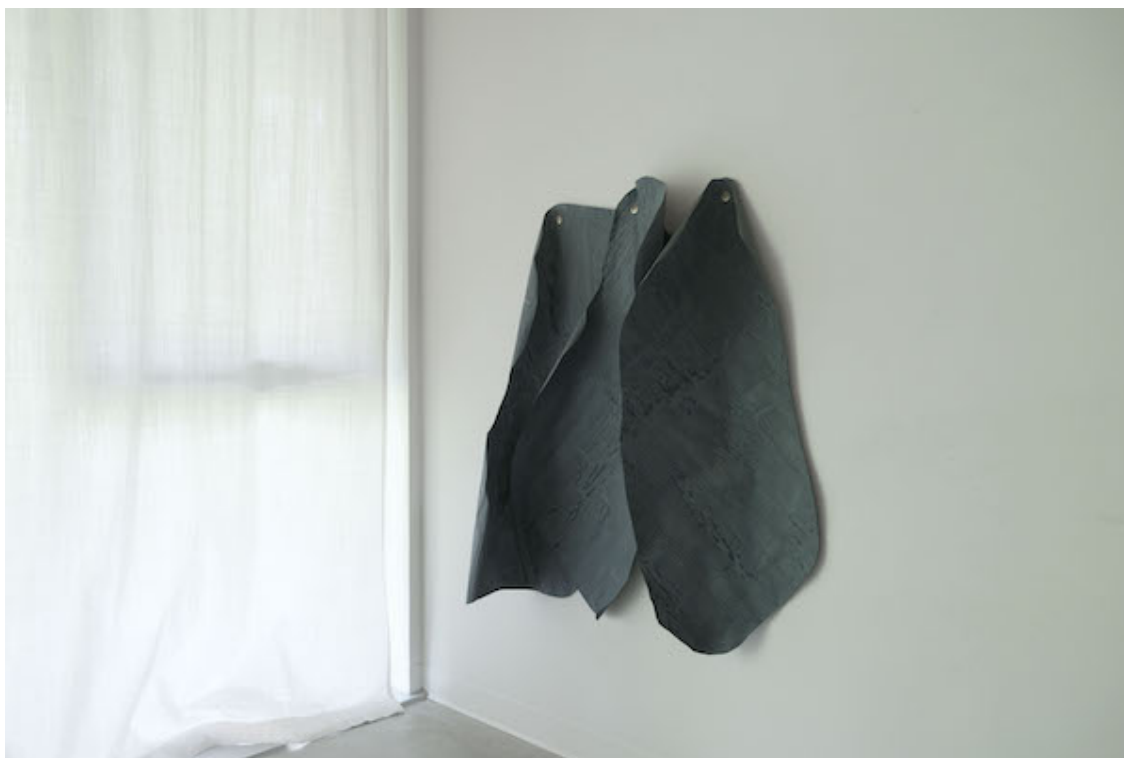
Stéphanie Auger, Vue d'atelier , 2021, gouache sur papier.