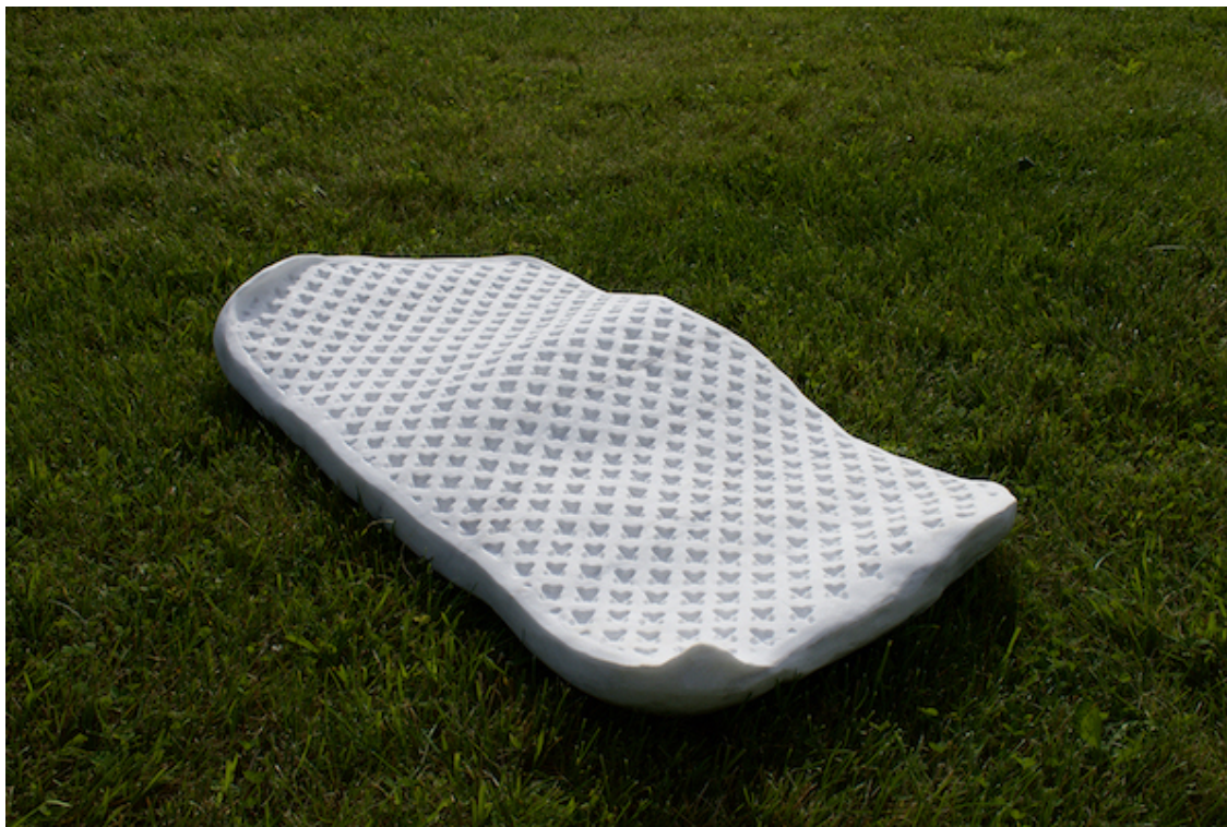
Ingrid Tremblay, Bump in the Carpet , 2019, marbre de Danby 10"x40"x20.