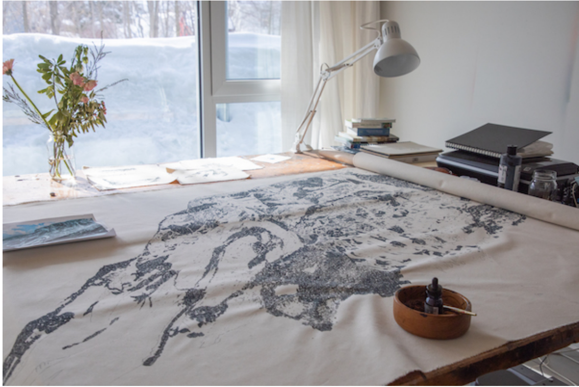
Karine Locatelli, Expérimentations menées en résidence, 2021.