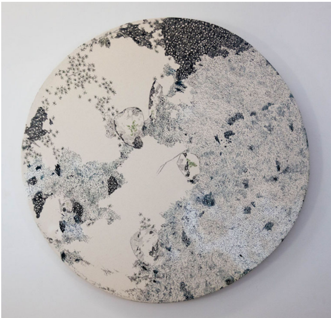
Karine Locatelli, Lichens sur rocher , 2018.