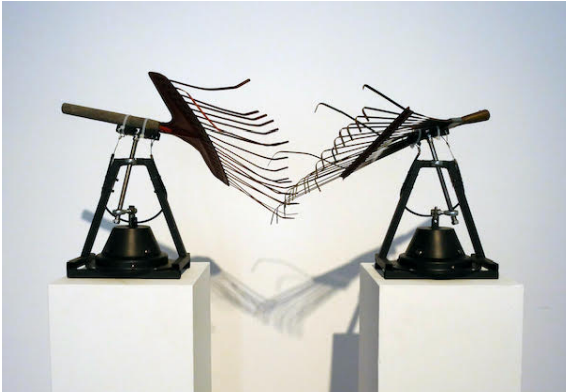
Adrien Lefebvre, Râteaux , installation sonore, 2016, râteaux, moteurs.