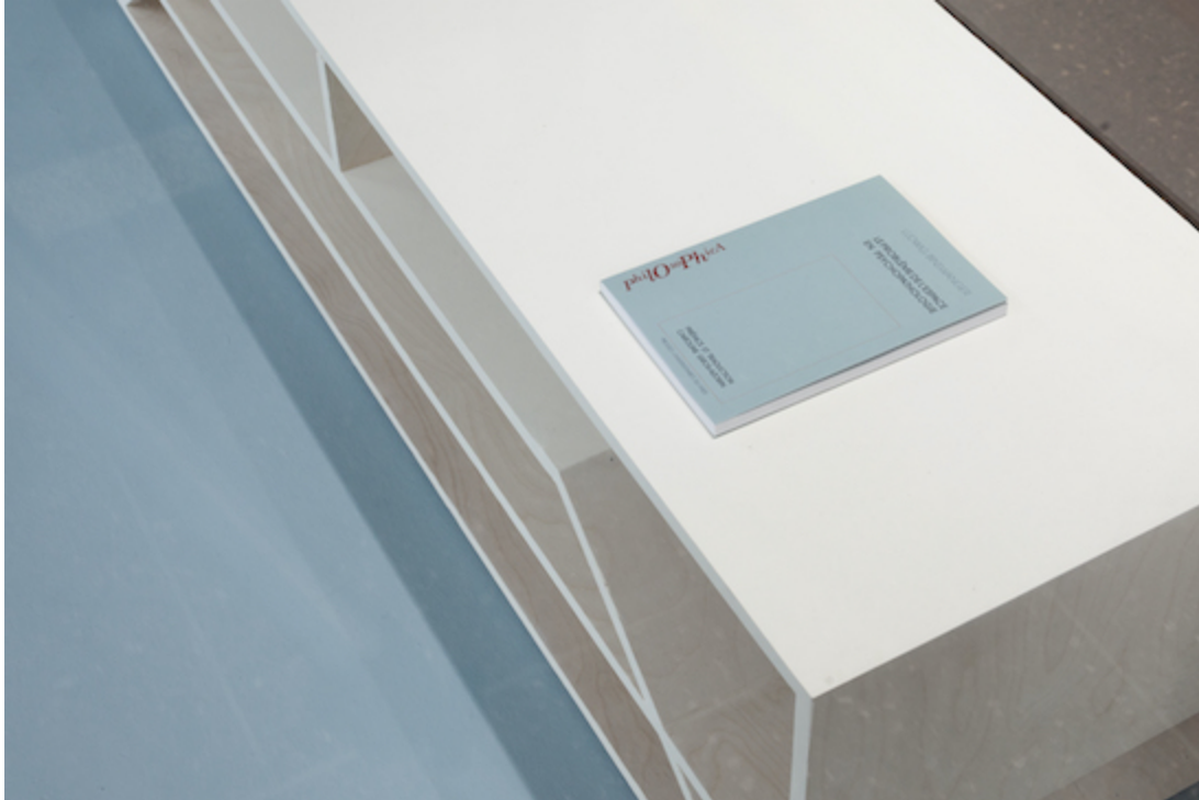
Alexandre Bérubé, SIGHTINGS: L'épreuve de la table de travail , 2018, installation.