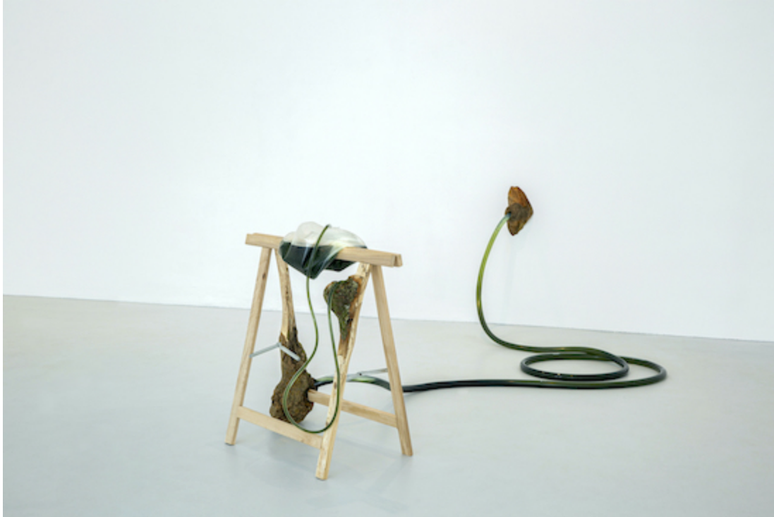
Lucy Andrews, Still , 2019, beech wood, trestle, plastic tubing, liquid chlorophyll, water container, dimensions variable.