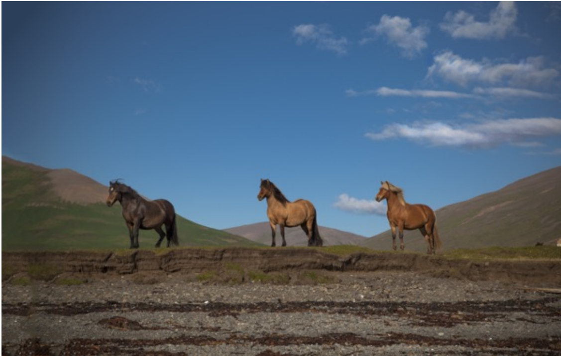
Hadar Mitz, Wild Houses , photography and inkjet print, 2018.