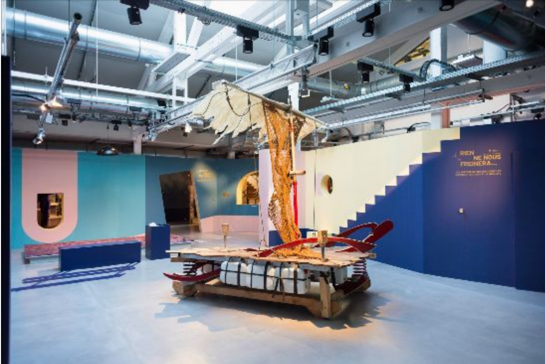
Baptiste César, en collaboration avec Yoni Doukhan, Le Râ d'Ô Jewel , radeau-jeu pour enfants en matériaux récupérés montés sur ressorts, plancher marqueté et dessins gravés, 2018