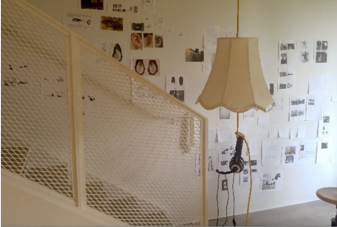
Miyuki Inoue, Vue d'atelier/Studio view , été/summer 2019