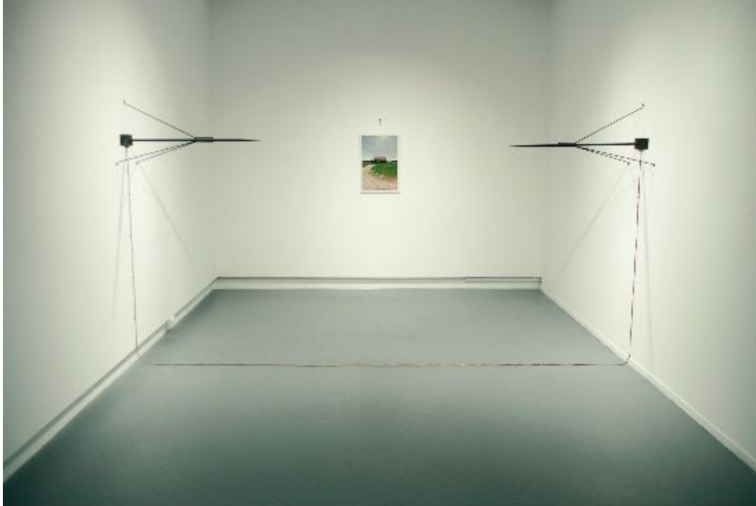
Mariane Tremblay, Capteurs de foudre , métal, fil de mise à la terre et cendre / La dernière vision , impression numérique et clou de grange, 2016