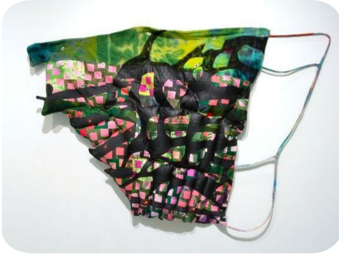
Amanda Smith, Limbo Cushion , acrylic, spray paint, mixed cotton fabrics, digital prints on cotton, wool, canvas, cord, grommets, polyfill, 2019