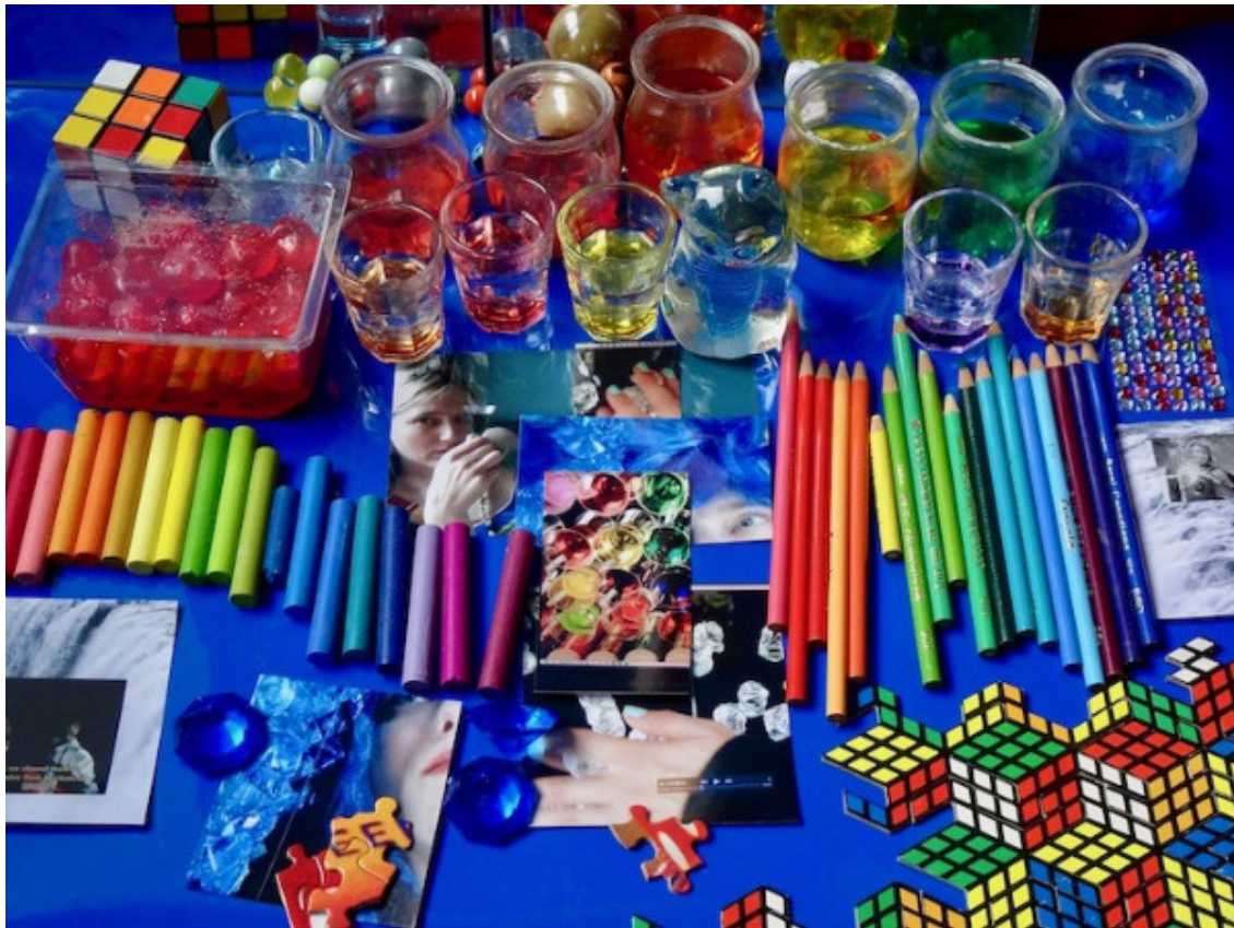
Kim Kielhofner, still from Third Reading , video, 2017