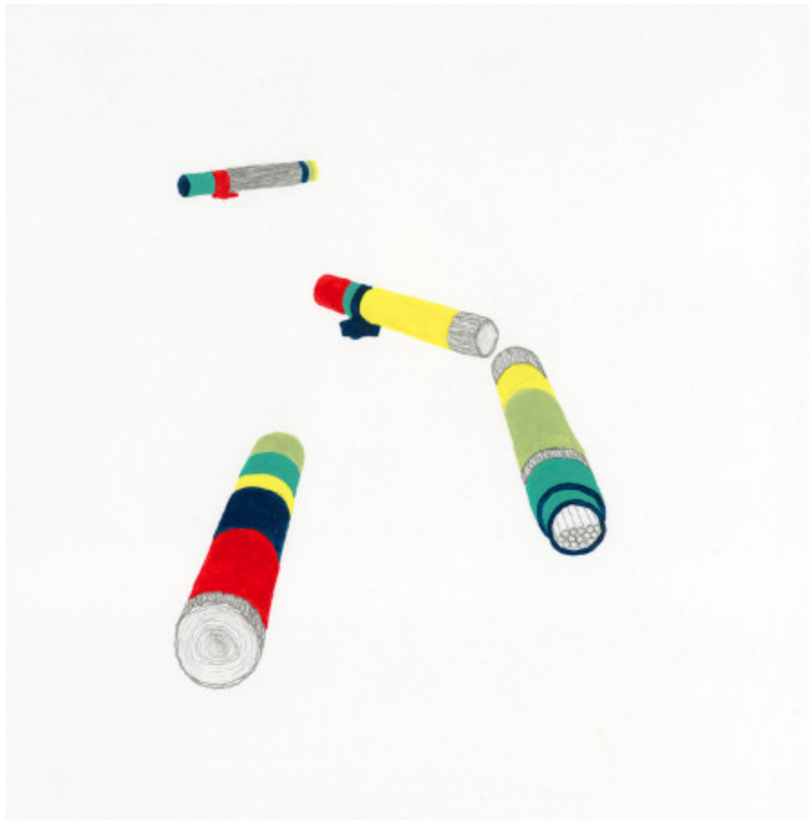
Billots électriques, peinture vinylique et graphite sur papier, 21 cm x 21 cm, 2016