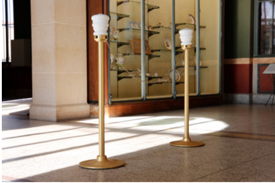
Oser Passer , 2016

départ des témoignages de diverses personnes à propos de paysages du Bas-St-Laurent pour lesquels elles ressentent un profond attachement.