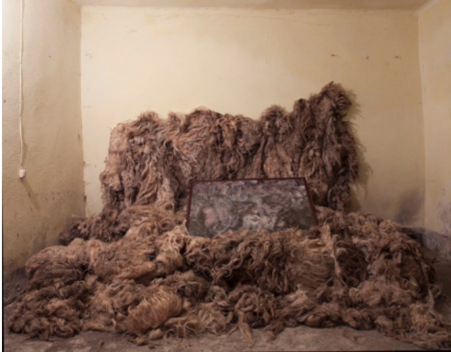
Testimony, laine de mouton, bois et photographie imprimée sur papier cotton, 2016