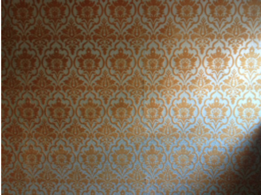
Untitled (Yellow Wallpaper) , 2012 © Kendra Place

Kendra Place est une artiste et auteure travaillant avec la photographie, le texte, la performance, le curatoriat et l'esthétique. Sa pratique imagine l'art comme des formes de critiques architecturales et de contre-récits féministes. Elle travaille avec des matériaux trouvés ou peu coûteux, des procédés amateurs ou non-officiels, et des formes littéraires vernaculaires ou mineures, avec un intérêt particulier actuellement pour la post-photographie. Son écriture adopte une approche fictive, historique et critique pour aborder les pratiques artistiques investies dans le féminisme intersectionnel. Ses textes, sa recherche et ses projets ont été présentés dans divers lieux, dont ngtvspc et Platform Center (Winnipeg), Artspeak (Vancouver), et Le Musée international des arts modestes (Sète). À Est-Nord-Est, elle entend élaborer des modes d'écoute de l'espace "surface listening" au moyen des pratiques de la marche et de l'écriture.